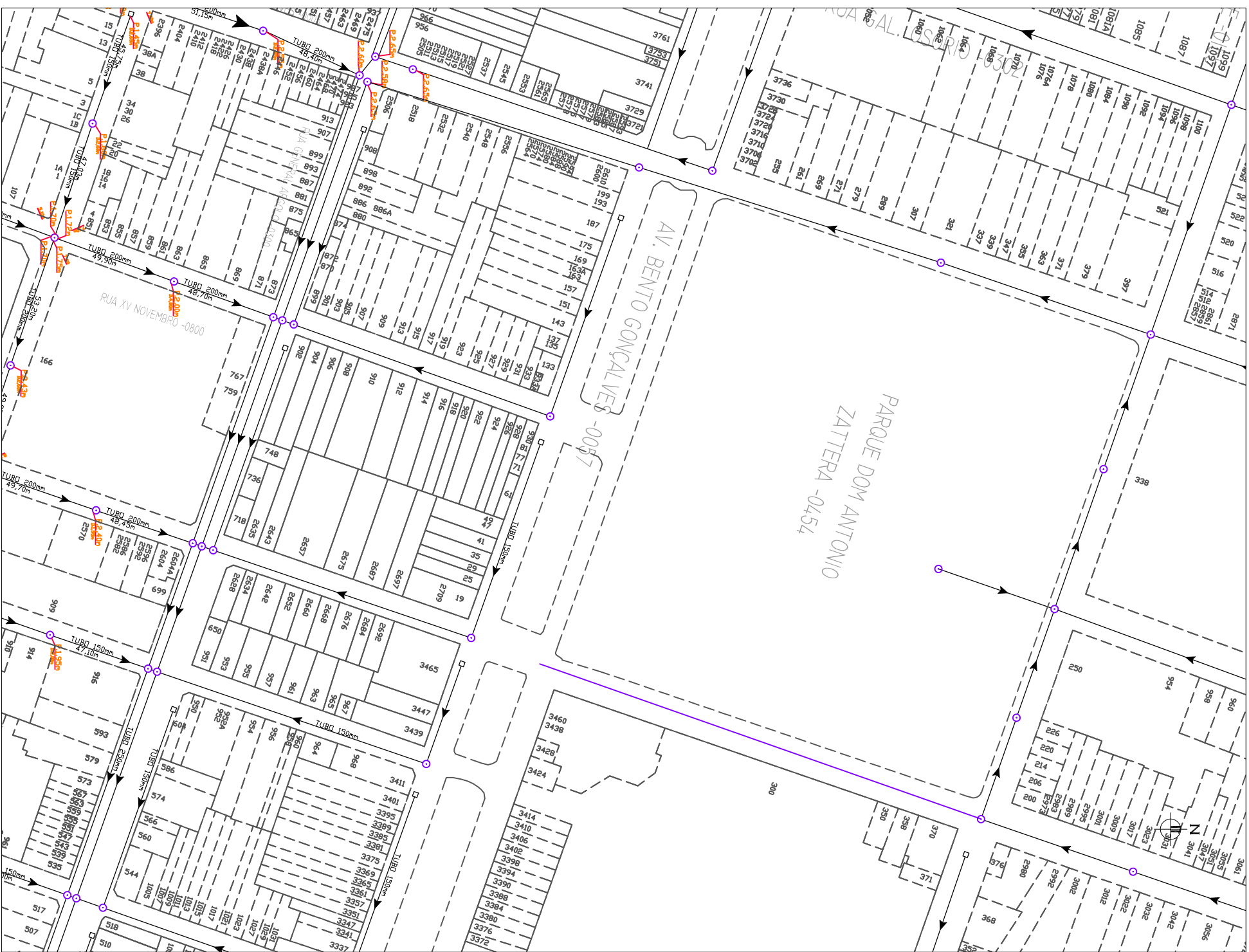
CADASTRO ESGOTO SANITÁRIO – AV. BENTO GONÇALVES