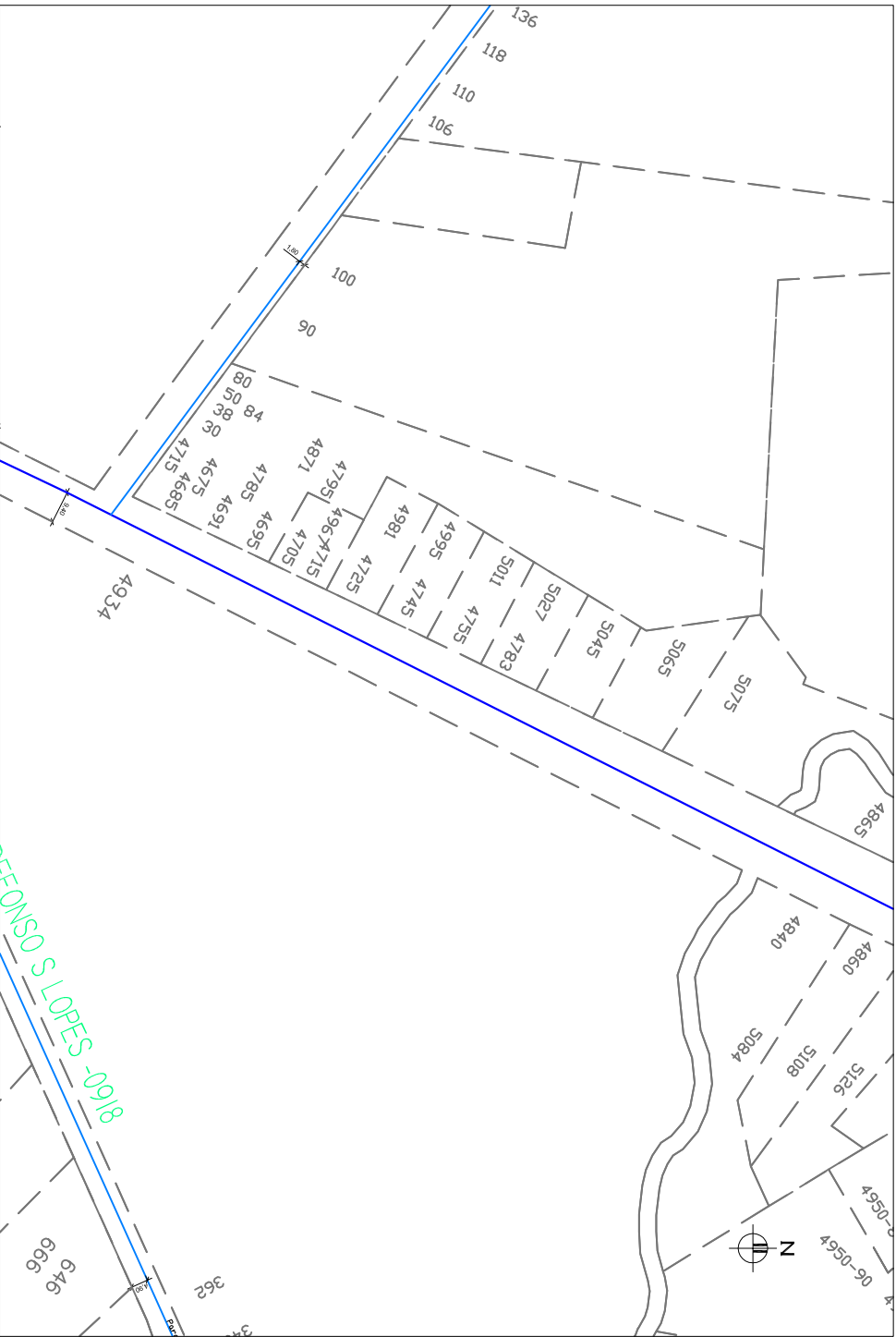
CADASTRO AGUA – AV. ILDEFONSO SIMÕES LOPES ESCALA 1:1.000 (A1) 1:2.000 (A3)